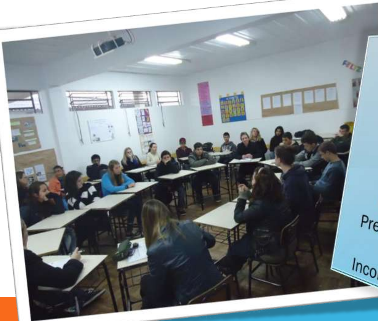
Imagem do jovem: Preconceito, Rebeldia, Fascinante, Vícios, Problema, Intenso, Cobranças, Pressões para o futuro, Inconsequente...